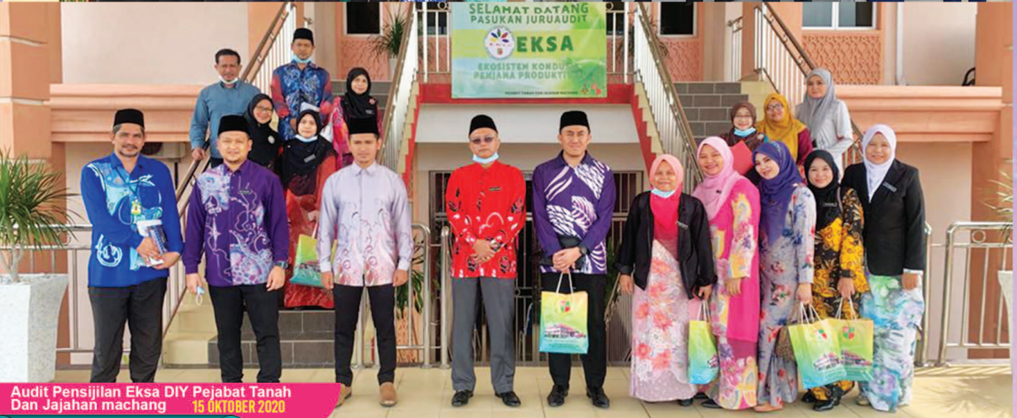
Audit Pensijilan Eksa DIY Pejabat Tanah Dan Jajahan machang 15 OKTOBER 2020